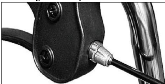
Vrchní regulace brzdy