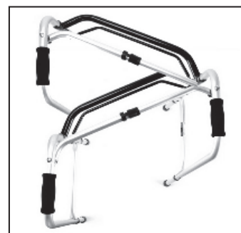
Krokový mechanismus (230 EL)