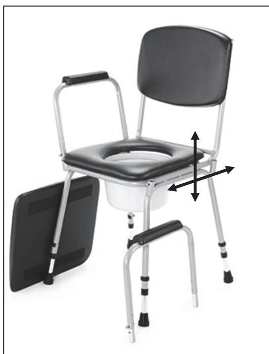
Vysunutí/zasunutí plastové nádoby

Pro použití křesla sundejte polstrovaný sedák a odstraňte víko plastové nádoby. Nádobu pak lze vysunout z držáků pod hygienickým prkénkem dozadu nebo vyjmout po odklopení prkénka horem. Po zmáčknutí pojistky (B) tahem nahoru velmi jednoduše vysunout madlo s područkou pro lepší nasedání.