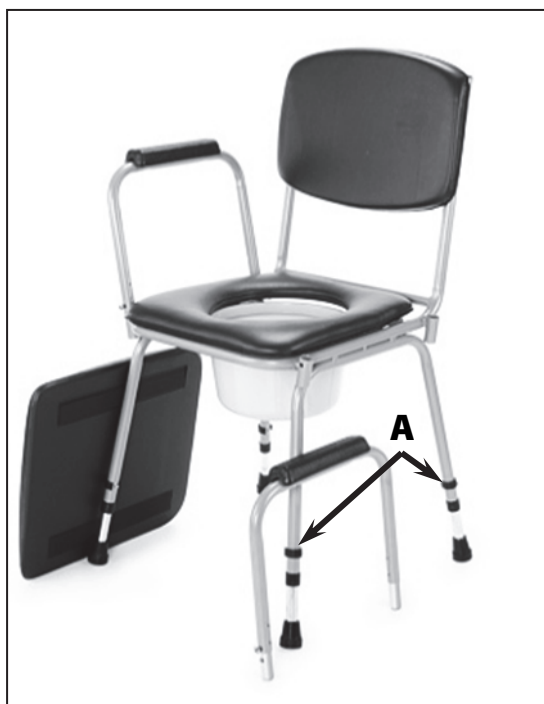
Umístění aretačních pojistek